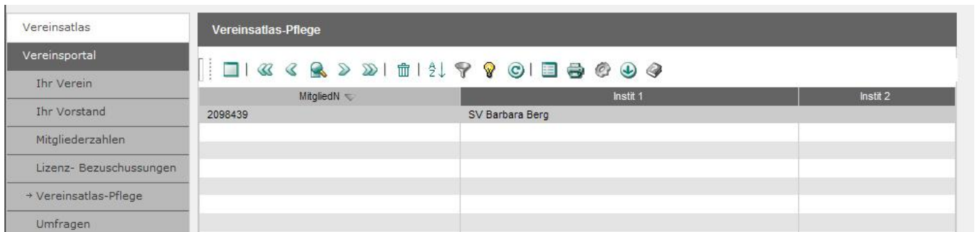
Abbildung: 12: Bereits bestehender Eintrag

Sie können Ihre Sportangebote jederzeit ändern und aktualisieren. Mit einem Doppelklick können Sie hierzu den entsprechenden Eintrag öffnen ( siehe Abb. 12 ).