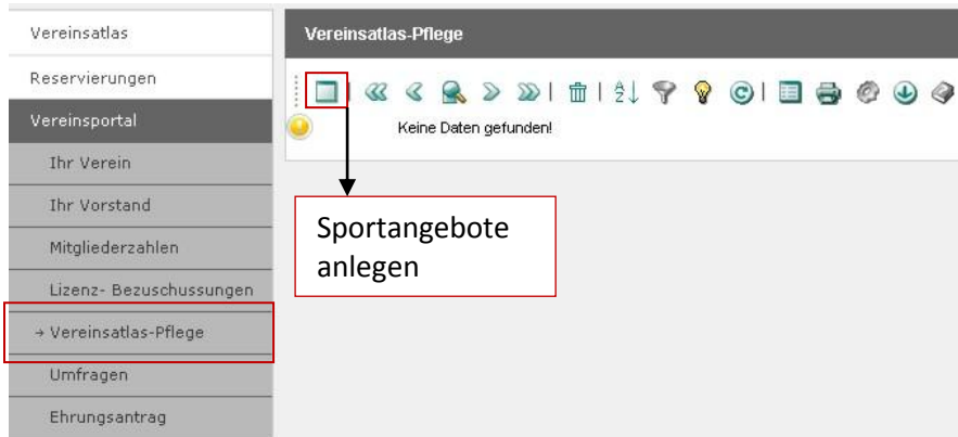
Abbildung 10: Sportangebote neu erstellen

Mit dem linken Symbol (Neuer Datensatz) können Sie Sportangebote neu anlegen (siehe Abb. 10).